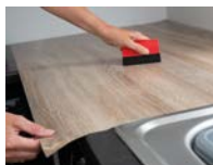
4. Folie ansetzen und mit Rakeel festdrücken.