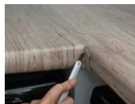
5. Folie mit dem Cutter zuschneiden bzw. abschneiden.