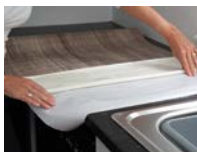
3. Papier 10 cm von der Folie abziehen.