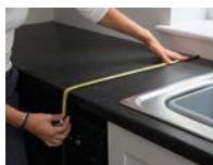
1. Fläche ausmessen