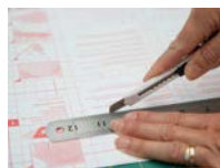
2. Folie mithilfe des Rückseitenpapiers zuschneiden.