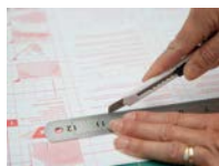
2. Сделайте выкройку с помощью бумажной подложки с разметкой.