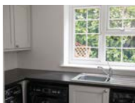
Вид до реновации