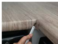
5. Отрежьте излишки пленки резакром.